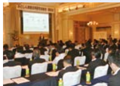
みとしん資産活用研究会