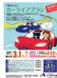
カーライフプラン