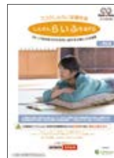
しんきんらいふ年金FS