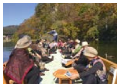
みとしん黄門会・年金友の会