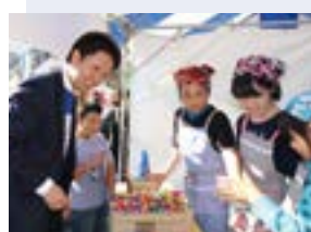
ジュニアエコノミーカレッジinみと