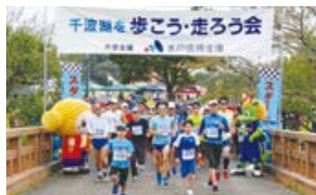
みとしん千波湖を歩こう・走ろう会