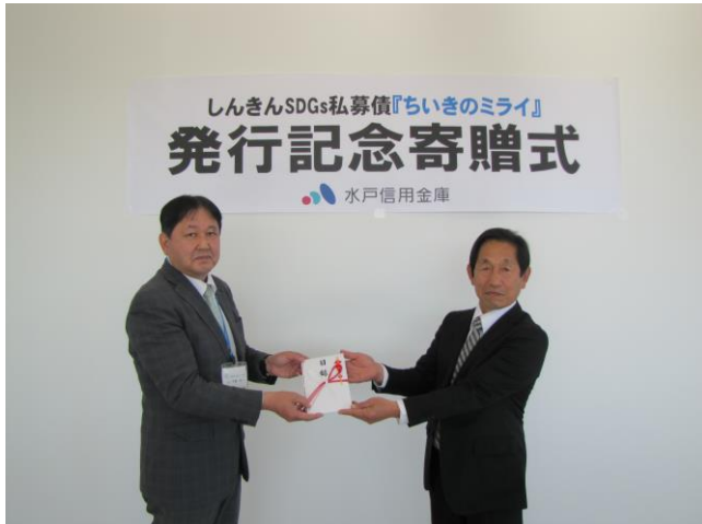
＜寄贈品贈呈の様子＞