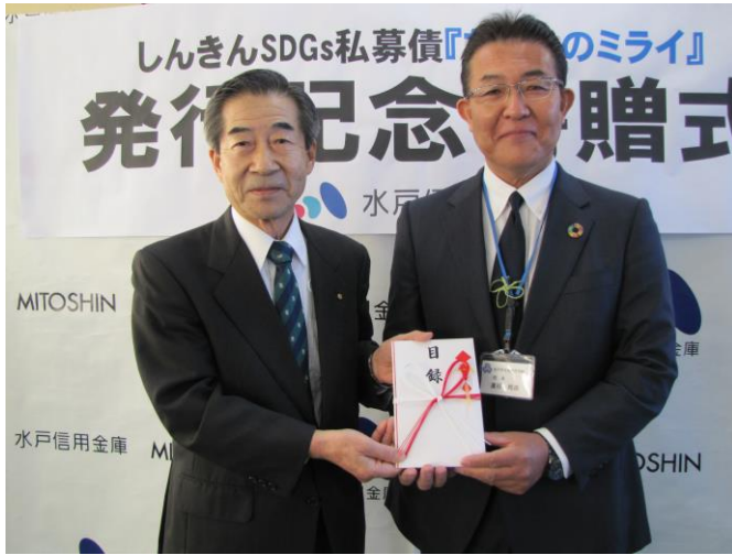
<寄贈品贈呈の様子>