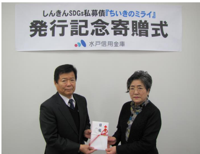
◀ 寄贈品贈呈の様子 ▶