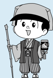
水戸信用金庫 イメージキャラクター みと信ちゃん