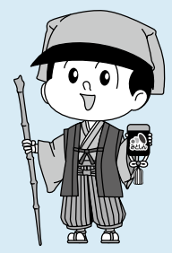
水戸信用金庫 イメージキャラクター みと信ちゃん