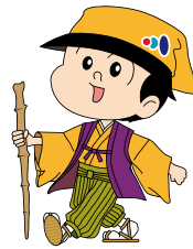
水戸信用金庫イメージキャラクター みと信ちゃん