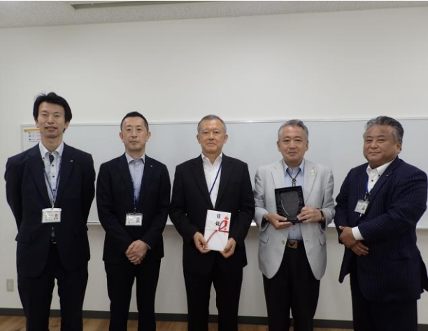
〈寄贈品贈呈後の様子〉