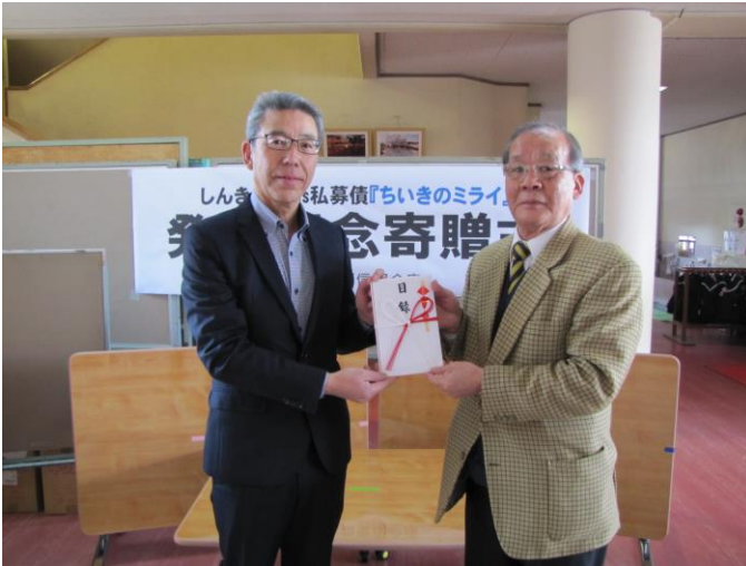
<寄贈品贈呈の様子>