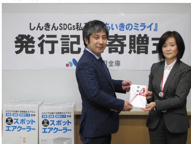
〈寄贈品贈呈の様子〉