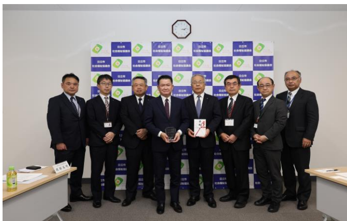
〈発行記念寄贈式の様子〉