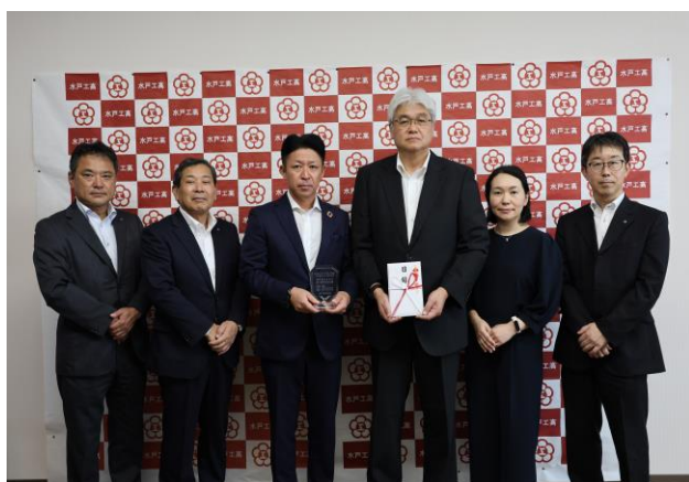
〈発行記念寄贈式の様子〉